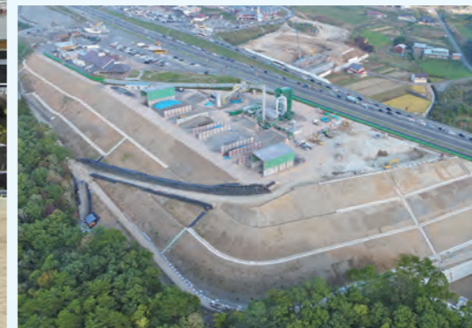
東海北陸自動車道ひるがの地区造成