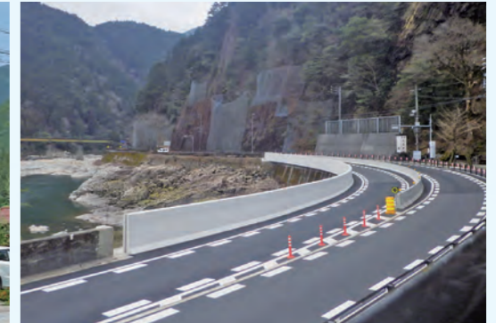
国道41号線保井戸地区道路改修