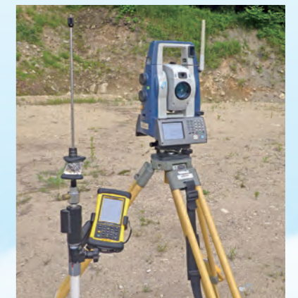
モータードライブトータルステーション

建設業の技術は常に進化し続けます。最新の技術を学び、それを活かし、更に次の進化につなげる。私たちは常に挑戦し続けます。