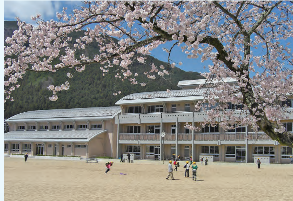
下呂小学校 校舎及び体育館

公共施設やホテル・店舗の新築、改修、耐震補強など、私たちの生活を豊かにする仕事。また、生活の基盤となる道路などのインフラ整備や防災工事・災害復旧工事など、まちをより安全にする仕事。そういった仕事をひとつひとつ積み重ねることで、まちづくりに貢献しています。