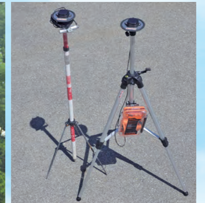
RTK-GNSS(全球測位衛星システム)