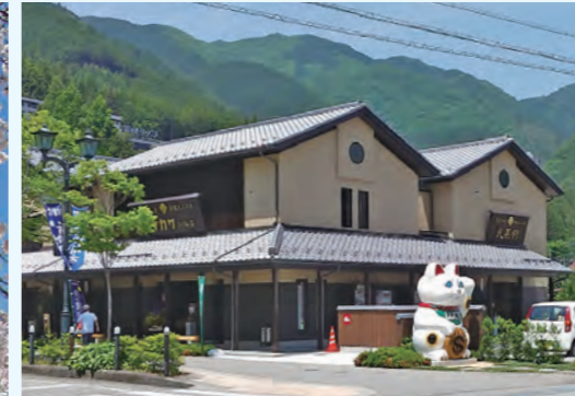
ヤマカワ招猫店新築