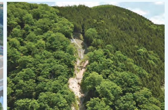
下呂市森 高岩ス地区治山工事