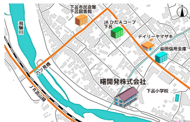
下呂市本社 案内地図